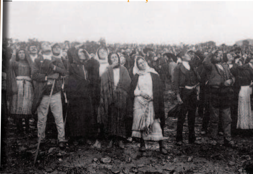
Mulțime de oameni observând dansul soarelui

scoasă de la spălătorie. În timpul acestei minuni, au avut loc mii de reîntoarceri la credință. Cei mai educați și inteligenți stăteau uimiți ca niște copii. Episcopul Fatimei, în scrisoarea pastorală oficială pe tema miracolului, a scris: „Mii de oameni au văzut acel dans al soarelui ... L-au văzut persoane din diferite grupe și clase sociale, credincioși și necredincioși, ziarisții principalelor gazete portugheze, și chiar oameni care se aflau îndepărtați de locul adunării.”