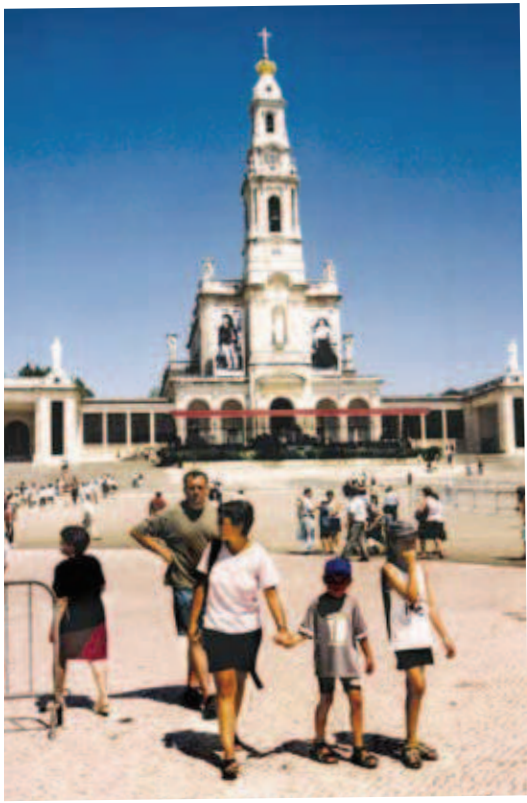
Sanctuariul de la Fatima