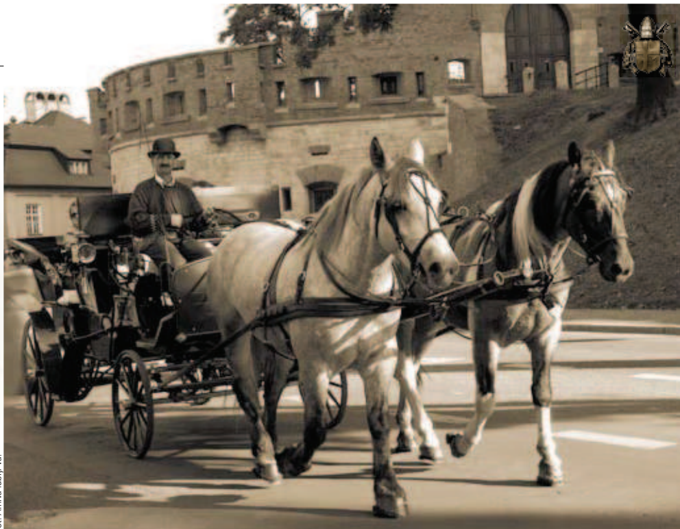
Străzi în Cracovia

Karol a jucat ca actor în „Antigona”, „Balladina” și alte piese care erau prezentate împreună de două gimnazii din Wadowice: