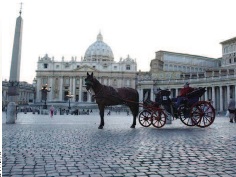
Bazilica Sfântul Petru

Teza preotului Wojtyła a fost despre Crediința în gândirea Sfântului Ioan al Crucii. A folosit din plin acest prilej pentru învățatură și rugăciune. În afară de studiile intense, l-a interesat Roma, în momentele libere vizitând locurile și monumentele acestui oraș sub îndrumarea cunoscătorilor temeinici. Ca echivalent, în timpul vacanței de Crăciun și de Paște, călătorea să viziteze alte orașe italiene. În anul 1947, de Paște, preotul Wojtyła s-a deplasat la San Giovanni Rotondo pentru a se întâlni și a se spovedi la marele stigmatizat și mistic Padre Pio. Întâlnirea