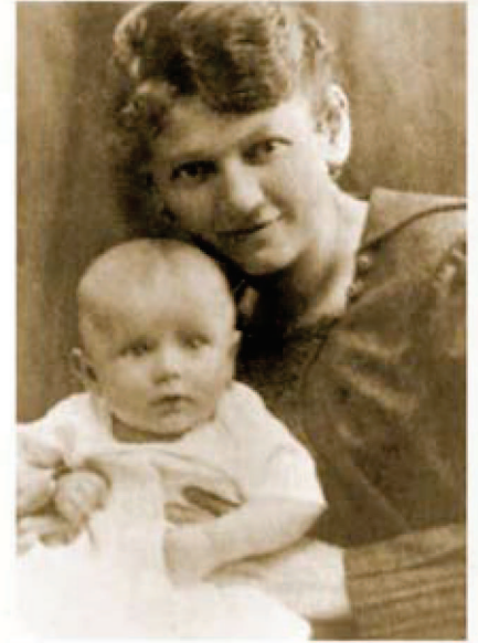
Karol cu mama, Emilia.

Micul Karol a crescut în atmosfera de credință profundă a părinților săi. O influență deosebită a avut asupra lui exemplul rugăciunii și auto-disciplinei tatălui. A văzut cu câtă ardoare se ruga și cum știa să ceară de la sine. Mulți ani mai târziu, Ioan Paul al II-lea scria: „Anii copilăriei și tinereții mele se leagă mai presus de toate de imaginea tatălui [...]. Am privit de aproape la viața lui, am văzut cum știa să ceară de la sine, am văzut cum îngenuchea pentru rugăciune. Acesta a fost cel mai important lucru în acei ani care înseamnă atât de mult în perioada de maturizare a unui adolescent. Tatăl care știa să ceară de la sine, într-un anumit sens, nu trebuia să ceară de la fiu. Uitându-mă la el am învățat că trebuie să fiu cu mine însumi exigent și conștiincios în îndeplinirea obligațiilor personale”.