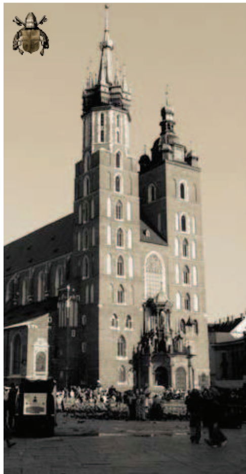
Catedrala Sf. Maria din Cracovia