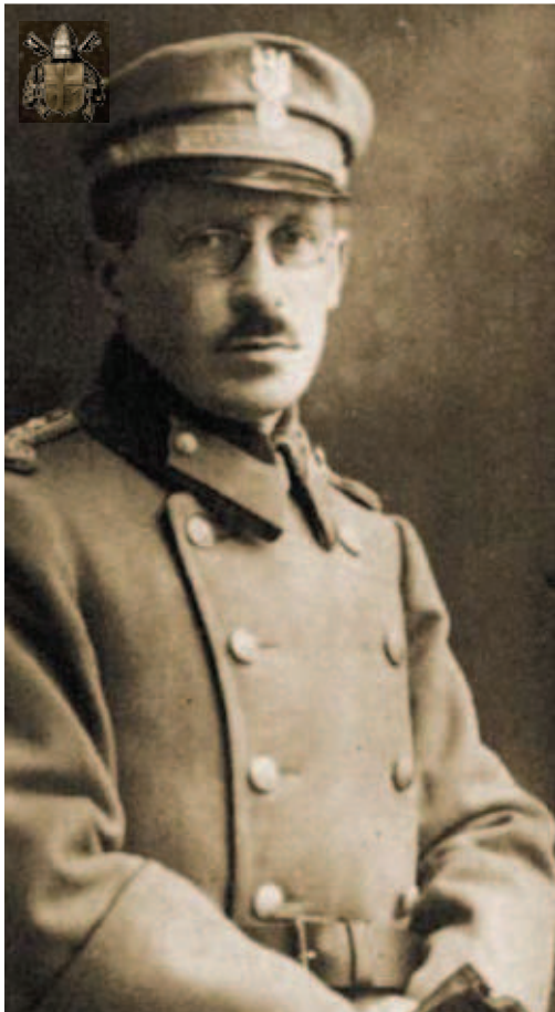
Tatăl lui Karol