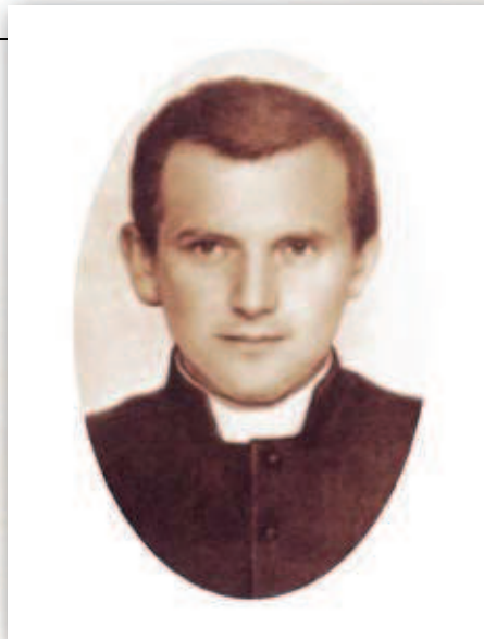
Karol Wojtyła, cler