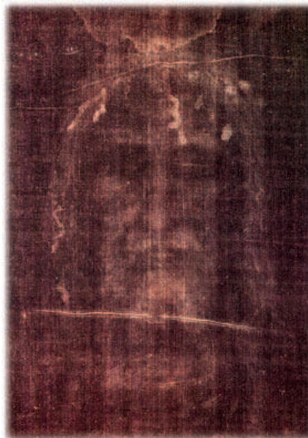
The face as seen on the Shroud

„Ez az értékes halotti lepel – mondta II. János Pál – segít megértenünk Isten Fiának irántunk érzett szeretetének titkát. Itt a lepel előtt, a leírhatatlan szenvedést látva, szeretném megköszönni Istennek ezt a különleges ajándékot, mely előtt minden keresztény meghajol, és megpróbál Krisztus követőjévé válni. (...) A lepel segít nekünk megérteni a szenvedés titkát, melyet Krisztus áldozata szentelt meg, és mely az egész emberiség megváltásának forrása lett.” (Torino, 1998.05.24.)