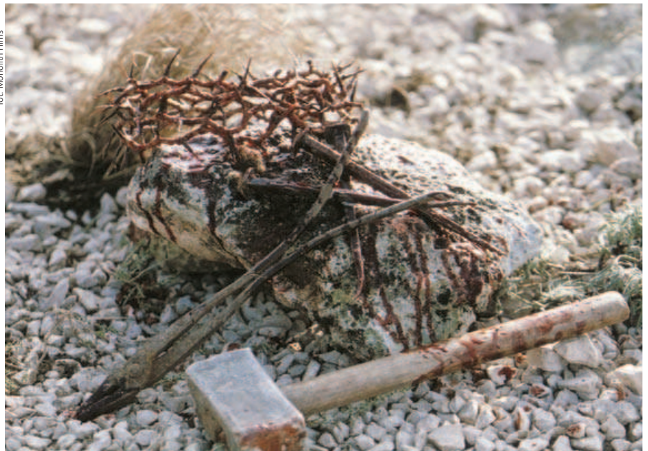
for. Monolith Films