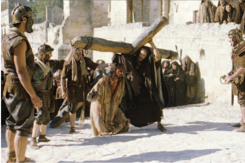
for. Monolith Films

nak be, tehát Jézus a kereszten többször megpróbált megemelkedni, hogy jobban levegőhöz jusson, és ilyenkor 65 fokot zárt be a váll vonala és a kereszt gerendája, amikor visszaesett, ez a szög 55 fokos volt. Pár pillanatra ilyenkor könnyebben tudott lélegezni, de a fájdalom és a fáradtság miatt újból visszaesett. Ez a fölemelkedés, visszaesés a kereszten körülbelül 3 órán át tartott és szörnyű fájdalmakkal járt. Idővel egyre sűrűbbé vált és a teljes kimerültségig, majd a halálig tartott.