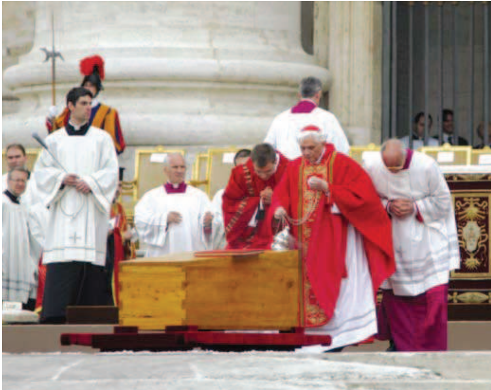
Oficierea slujbei de înmormântare .