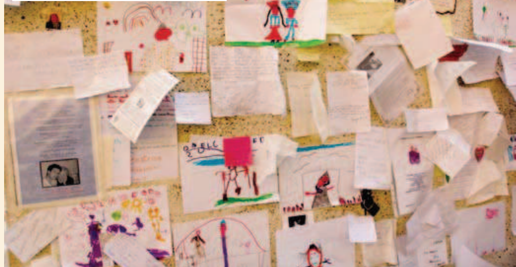
Expresia recunoștinței lăstate de pelerini în Piața în Sfântul Petru.