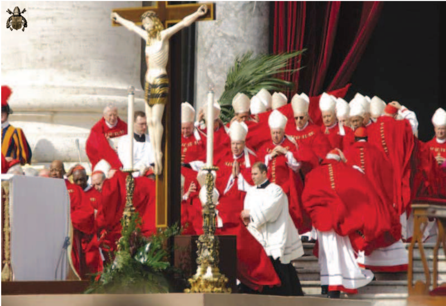
Oficierea slujbei de înmormântare .