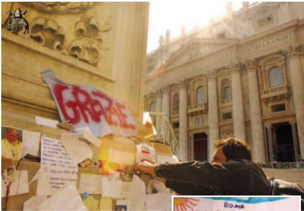
Expresia recunoștinței lăstate de pelerini în Piața Sfântul Petru.

“Sculați-vă să mergem” (...) Chiar dacă aceste cuvinte înseamnă o probă, un mare efort și un strigăt dureros, nu trebuie să ne fie teamă de nimic. Aceste cuvinte conțin de asemenea bucurie și pace, care sunt surorile credinței.