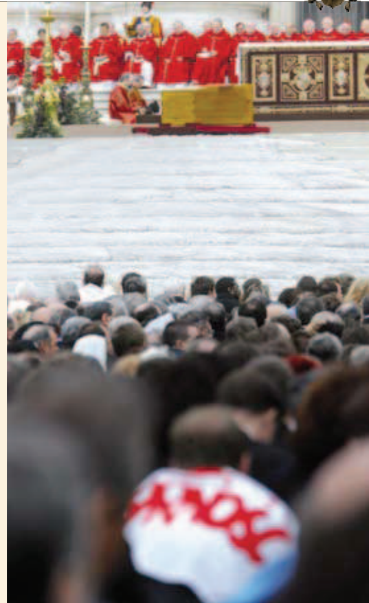
Oficierea slujbei de înmormântare .

Îi permitem Domnului să transforme inimile noastre, să le elibereze de păcate și să le facă să fie capabile de iubire. Oamenii își fac un mare rău atunci când nu se roagă sau încetează să se roage, pentru că atunci viața lor duhovnicească se chircește și moare, devine fără putere în fața atacurilor răului care îi distruge și îi manipulează.